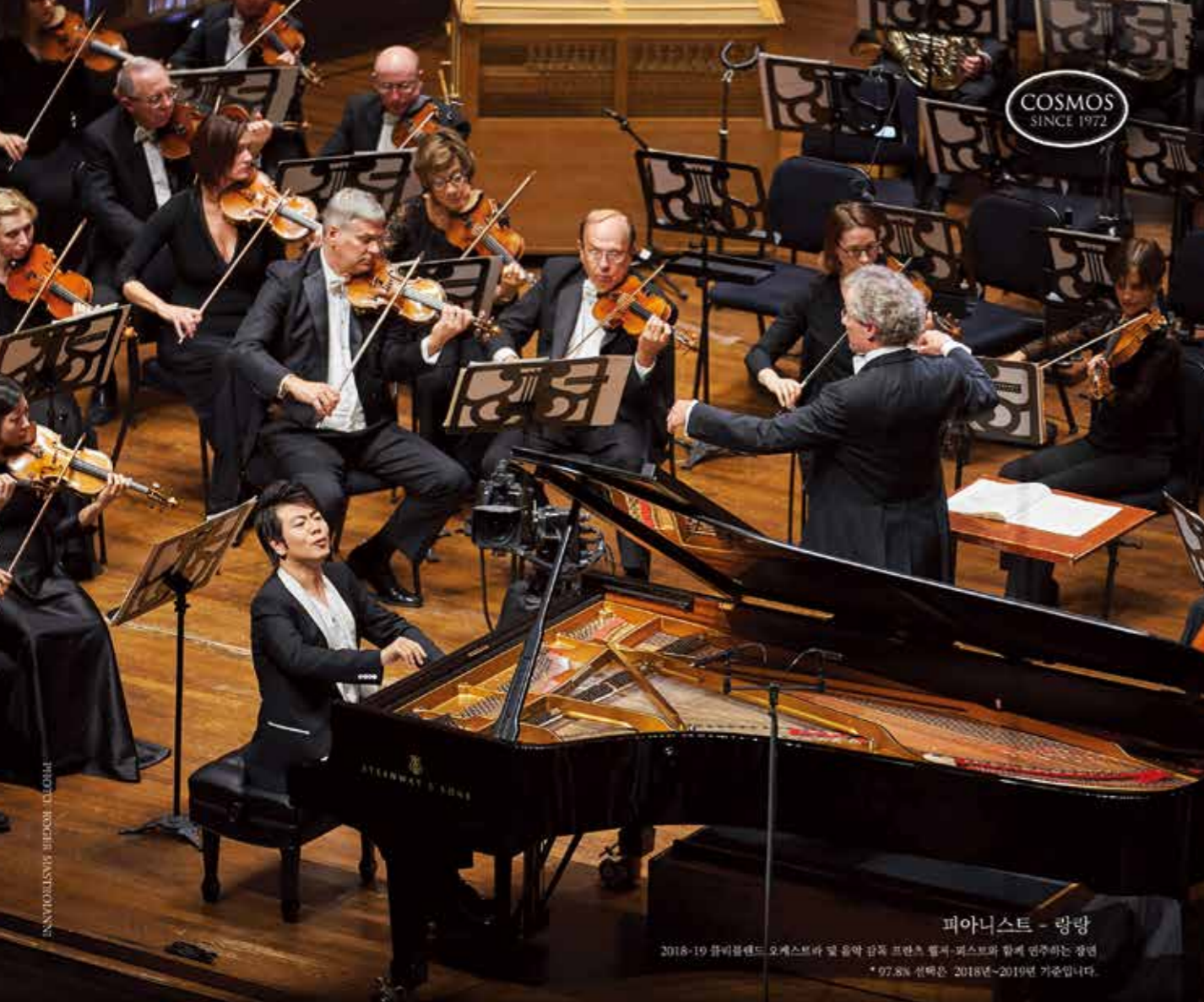
피아니스트 - 랑랑

2018-19 클리블랜드 오케스트라 및 음악 감독 프란츠 페르-피스트와 함께 연주하는 장면 * 97.8% 선택은 2018년~2019년 기준입니다.